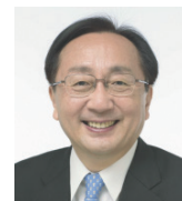
青森県知事 三村 申吾 氏

14:15 ~ 16:30 講演&ワーク 『介護現場でイキイキ働けるコツ教えます!』